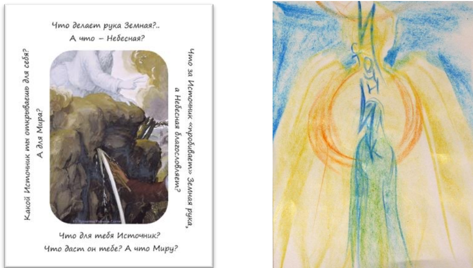
Рис. 3. Результат роботи з картою №41 в техніці «Слово на день...»

Як вже було зазначено, працювати зі смислом можна за допомогою будь-яких МАК. Вправи можуть бути як невеликими (з використанням одного набору МАК), так і досить об'ємними (з використанням кількох наборів МАК). Наприклад, з МАК «Руки» (автор Т.Бородулькіна; авторські права захищені (Свідоцтво № 73800 Україна, 2017)) можна провести невелику роботу щодо пошуку нового смислу. У вправі пропонується вибрати одну карту з МАК «Руки», яка найбільше відповідає відповіді на запитання «Які ще дії мені допоможуть знайти новий смисл?». Вибір картки можна робити як відкрито, так і наосліп. Більше прикладів як конкретних вправ роботи зі смислами за допомогою МАК «Руки», так і описів клієнтських випадків, наведено в попередніх публікаціях автора (Бородулькіна, 2019).