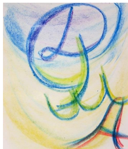
Рис. 1. Результат роботи з карткою №1 в техніці «Слово на день...»

Приклад 2. При роботі з карткою №37 з МАК актуалізації