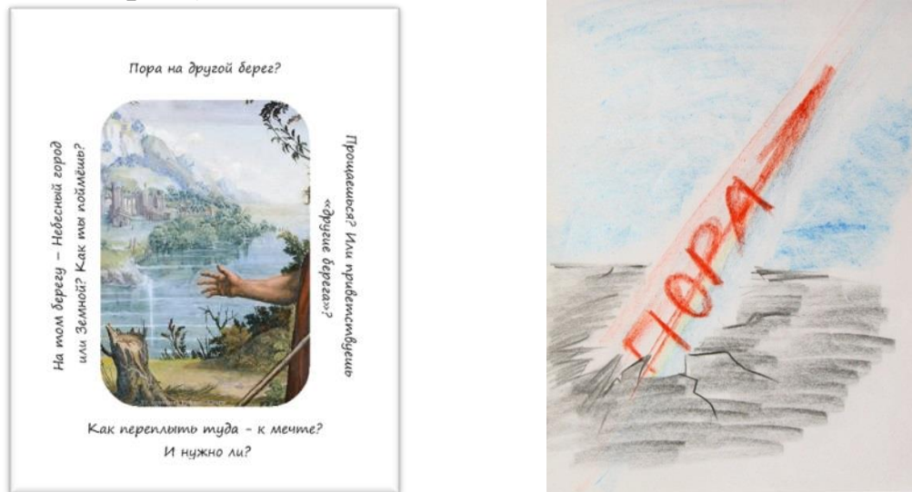
Рис. 2. Результат роботи з картою №37 в техніці «Слово на день...»

екзистенціальних смислів «Руки Небесні або Земні», Б. обрала слово «Пора» в наступному запитанні: «Пора на другой берег?» (укр.: «Час на інший берег?») (див. рис.2). До малюнку надано таке письмове пояснення: «Це слово червоне, впевнене, гучне і яскраве. Воно закликає до змін, вирішальних кроків. Вилітає стрілою зі старого світу – в інший, новий; розбиває перешкоди на дорозі. Час прийшов! (рос.мовою: «Пора!»)».