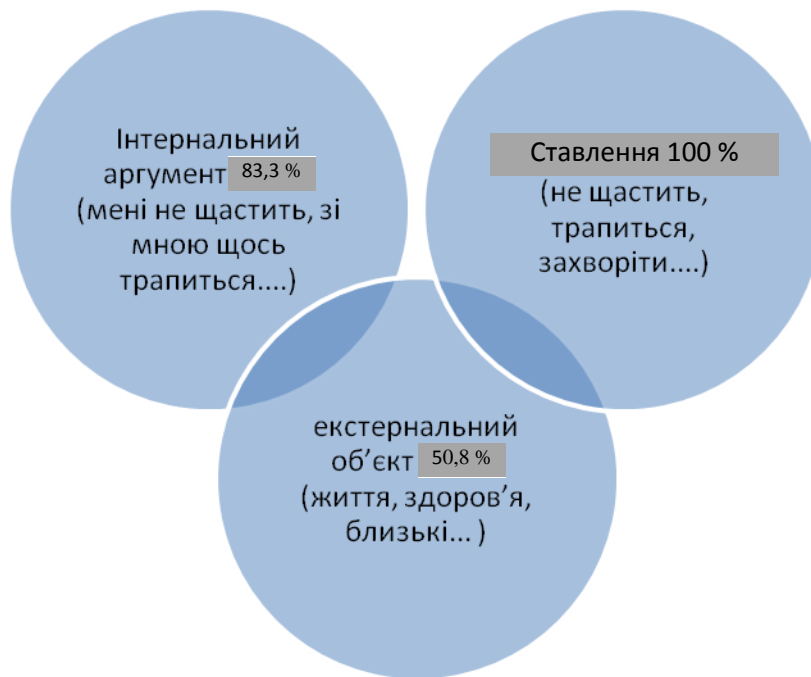
Рис. 3. Пропозиціональна структура вербалізованих глибоких переконань безпорадності / контролю

Аналіз результатів теоретичного й емпіричного досліджень негативних глибоких переконань особистості дає змогу дійти висновків про існування трьох груп – неприйняття / нестача любові, безпорадність / низькі досягнення та безпорадність / нестача контролю, які мають свою специфічну пропозиціональну структуру й потребують особливої психолінгвістичної реорганізації. Найбільш поширеною групою в досліджуваних студентів є переконання безпорадності / низьких досягнень, що зумовлено їх віковими особливостями та провідною діяльністю. Перспективним вважаємо психолінгвістичне дослідження негативних глибоких переконань у різні вікові періоди особистості, у різних професійних і статевих групах, що дасть змогу реалізувати діагностичний та терапевтичний потенціали психолінгвістики в наданні психологічної допомоги й підтримки особистості.