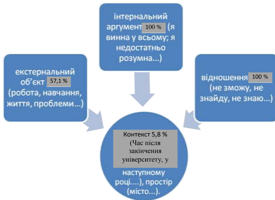
Рис. 2. Пропозиціональна структура вербалізованих глибинних переконань безпорадності / низьких досягнень

можна з'ясувати, чи були випадки в житті (конкретний простір і час), де їй удавалося успішно розв'язати певні життєві завдання. Корисне породження пропозицій із такою самою структурою: ієтернальним аргументом, ставленням (предикатами без частки «не» і з позитивною семантикою), екстернальними об'єктами й контекстом (конкретним часом і простором), де людині вдавалося досягти конкретних, навіть незначних успіхів. Результати дослідження переконань безпорадності / низьких досягнень засвідчує, що вони зосереджені на переживаннях, породжених ставленням до себе.