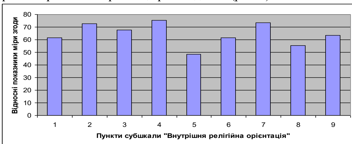
Рис. 2. Відносні показники міри згоди респондентів із внутрішньо орієнтованими релігійними твердженнями

Переходимо до аналізу міри вираженості окремих аспектів внутрішньої релігійної орієнтації респондентів (рис. 2):